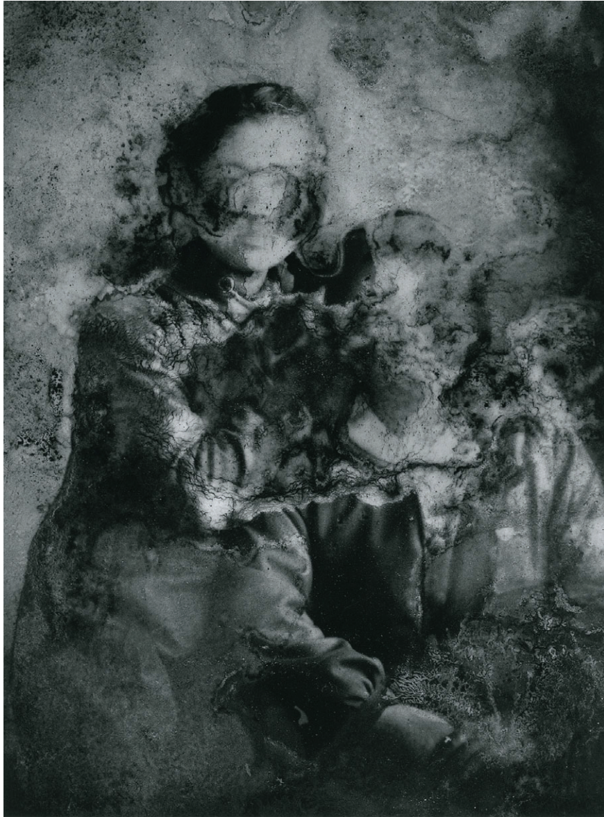
↑ New coast, and a fragment over a woman. #002