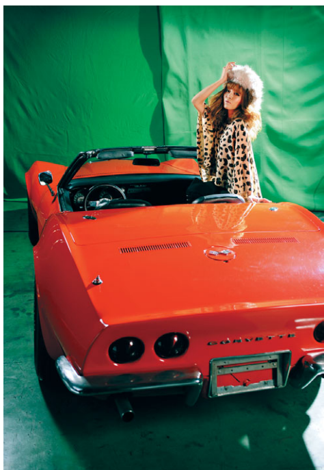
ブックレット中面イメージ合成前