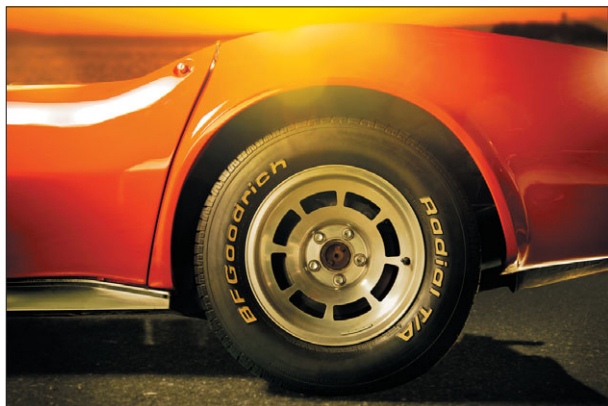
トレイ下の合成工程