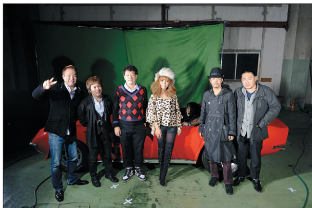
撮影時はディレクションを担当